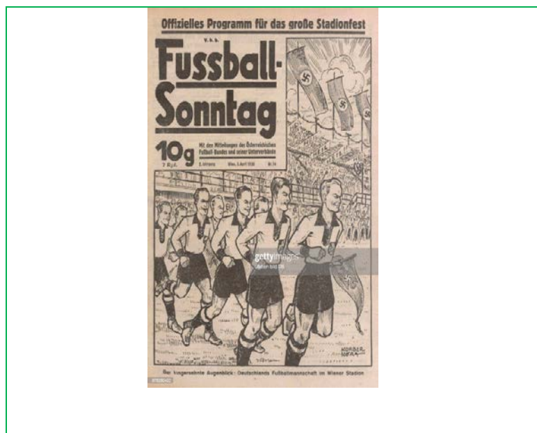
Figura 4. Fussball, Annexionsspiel Österreich - Deutschland 2:0 in Wien 1938. Partido celebrado para conmemorar la anexión alemana de Austria, el resultado fue de 2 a 0 favorable a los austriacos.