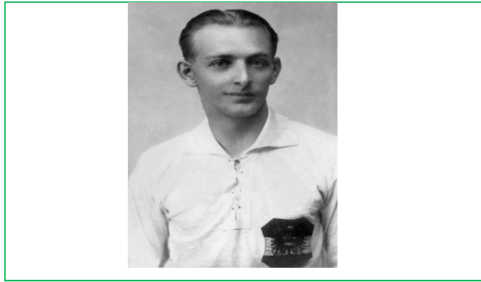
Figura 5. Mattias Sindelar.

En cuanto al estadio del Prater donde el Austria solía hacer de equipo local, se utilizó como acuartelamiento de las tropas nazis. Los nuevos gerentes del club de ideología nazi con el dinero que los austriacos habían conseguido con su triunfo en la copa Mitropa, se dedicaron a comerciar con artículos deportivos con clubes de Alemania, sobre todo, con el equipo del Schalke 04, club elegido por los nazis, como comenta Francka (2016), por su arraigo con la clase trabajadora y así poder acercar su ideología a dicho estrato social popular.