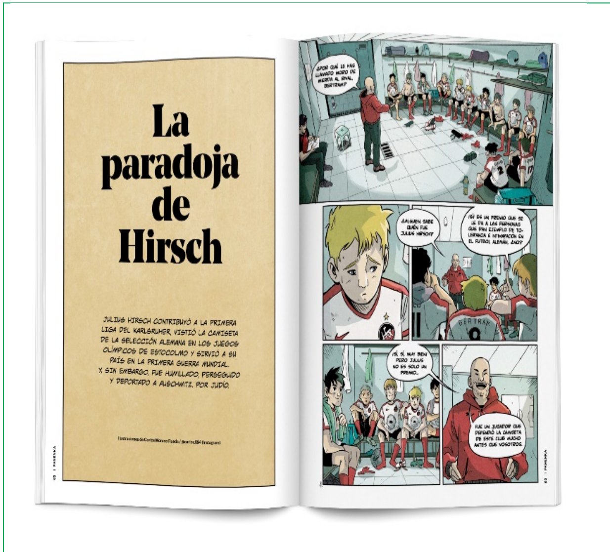
Figura 2.

Posteriormente el COI designó a Berlín como sede de los Juegos Olímpicos de 1936. El fútbol regresó como disciplina olímpica, fue la oportunidad para que Goebbels, ministro de propaganda del régimen, difundiera sus tesis a través del deporte. Pereleman (2014), comentaba que el conocimiento del deporte lo era también de la sociedad. Ya era costumbre entre los jugadores hacer el saludo nazi como acto de protocolo. Los futbolistas judíos habían sido expulsados de las competiciones, y más de uno desapareció de manera misteriosa. En la justa olímpica se enfrentaron Alemania y Noruega en los cuartos de final fue el único partido del que se tiene registro de la presencia de Hitler quien esperaba una victoria teutona, sin embargo, aquel partido lo ganaron los noruegos y el Führer abandonó el estadio antes de que terminara el juego.