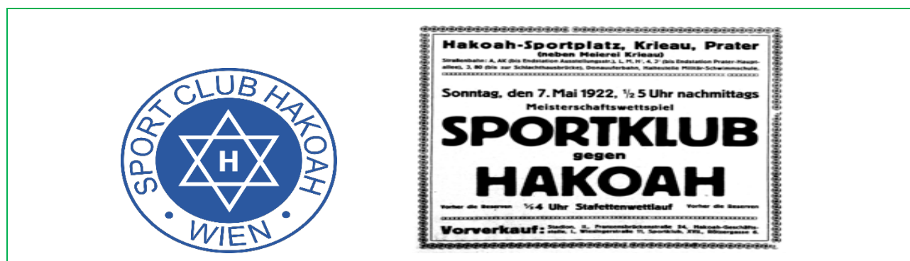
Figura 5. Escudo de Hakoah y Noticia diario deportivo Sontag encuentro Sportklub vs Hakoah, 7 mayo 1922.

Sólo un día después de la anexión de Austria 12 de marzo de 1938, el club se disolvió, el Hakoah fue prácticamente borrado como entidad deportiva; sus miembros fueron perseguidos, muchos huyeron al extranjero, otros fueron deportados a campos de concentración donde encontraron la muerte. “El Hakoah fue aplastado por los nazis el campo de deportes en Krieau y las casas fueron confiscadas. Muchos miembros huyeron a palestina” (Schwaiger, 2008, 42). El Hakoah realizó numerosas giras por todo el mundo en 1923, se convirtió en el primer equipo que derrotaba en el Reino Unido a un club británico, el West Ham por un abultado 5-0. También realizaron una gira por la ciudad de New York donde llegaron a llenar los estadios. Los bienes del club judío vienes Hakoah, campeón de Austria en 1925 fueron confiscados. Como comenta Marschik (1999), en 1938 muchos periodistas deportivos eran judíos, con lo que quedaron afectadas las páginas de los periódicos