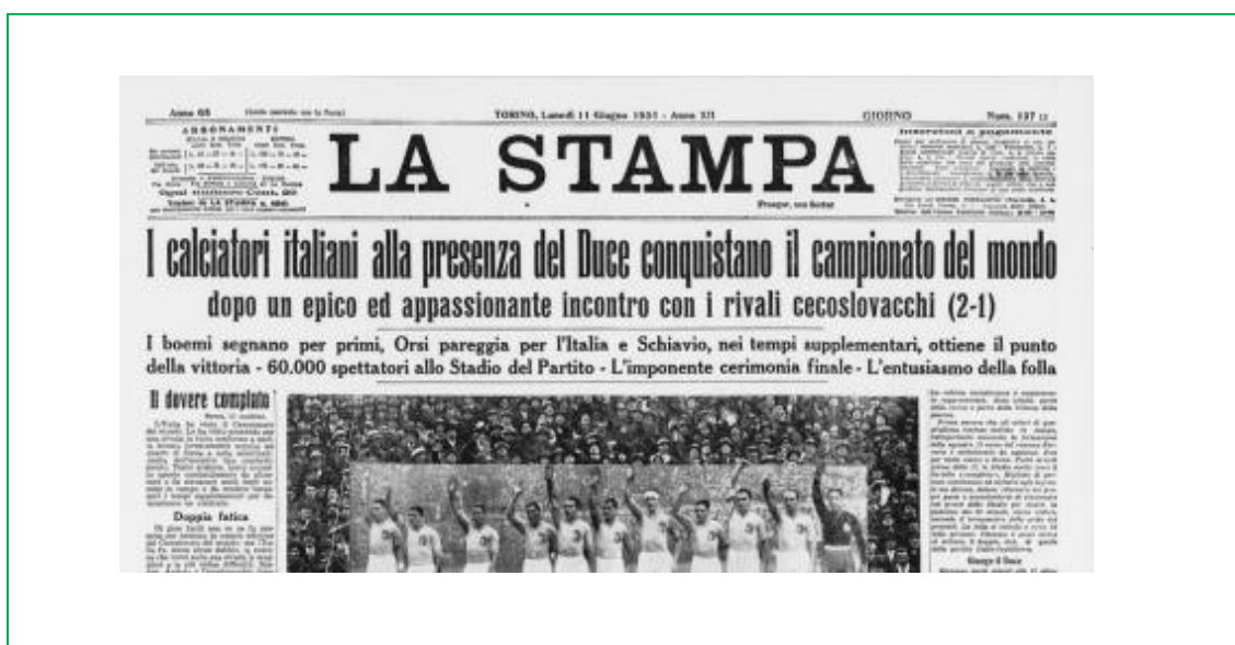
Figura 6. Diario "La stampa" Torino, N. 137, 11 junio 1932, año XII

Una vez concluido el torneo con la victoria italiana, Mussolini concedió el título de Commendatore (grande en su profesión) al seleccionador Vittorio Pozzo. La atmosfera del campeonato debido a las presuntas ayudas arbitrales a la anfitriona, había incomodado a más de un observador neutral comentando que las exaltaciones patrióticas habían sido demasiado intensivas: "la mística que se ha forjado la selección italiana, y aquella en que ha participado todo el público, no son compatibles con el rigor de un criterio" (Tejero y Rincón, 60). La Copa del Mundo de Italia aportó 55.778 francos suizos, ya se estaba preanunciando el interés financiero que traería aparejado dicho torneo.