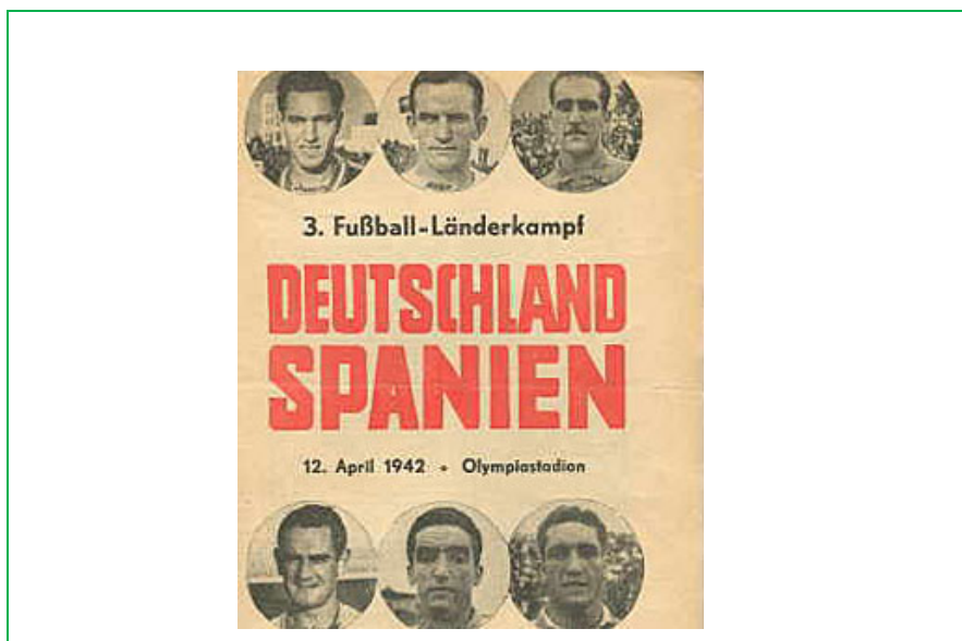
Figura 3. El cartel anunciador del encuentro que enfrentó a las selecciones de Alemania y España como homenaje a la División Azul.