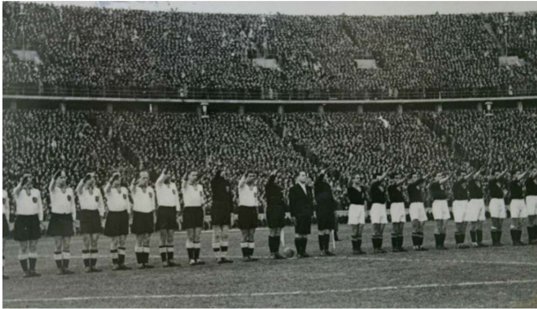
Figura 4. Alemania vs España.